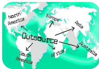
外包與組織扁平化